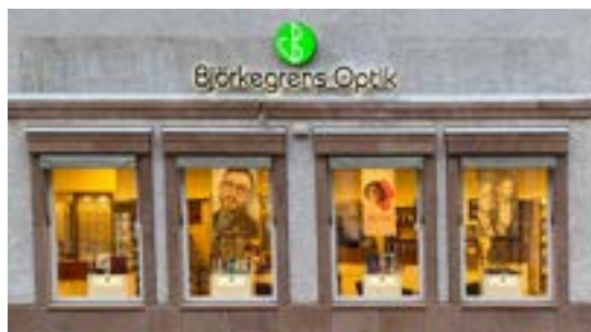
Västra Sjögatan 16, 2024

Sedan augusti 2002 ligger vår anrika butik här, bara 50 meter från Kalmar Domkyrka. Vår ambition är att vara Kalmars bästa optiker, någon man kan lita på och gärna rekommendera sin omgivning. Igår, idag och förhoppningsvis många år framöver.