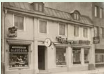
Kaggensgatan 17, 1968