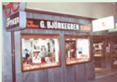
Kaggensgatan 17, 1979