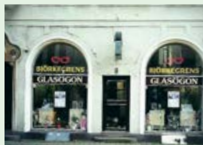
Storgatan 8, 1990